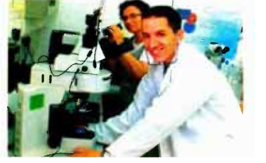
המרכז הרפואי פוריה והמכללה הטכנולוגית