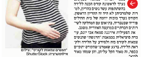
"הנשים צמאות לקורס"