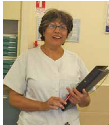
כמה מילים על התפקיד: