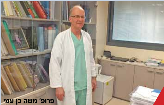
פרופ' משה בן עמי