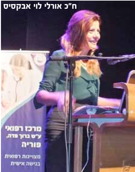
ח"כ אורלי לוי אבקסיס

התמקדה בקושי של הבנים לספר ולהיחשף, "ישנם גורמי הסתרה שהם אופייניים רק לבנים, בנים חוששים שיסומנו כבעלי נטייה חד מינית או יסווגו ע"י הקהילה סביבם כ"לא גברים" - כי גברים לא אמורים להיות קורבנות, הם אמורים להיות עוצמתיים ושולטים במצב. חשוב להימנע מתיג