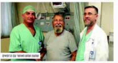
מרכז הרפואי "פדה פוריה" חדר ניתוח מודרני וסקולרי

לאשתו במערך הרקודי וסקולרי במרכז הרפואי "פדה פוריה", הושחל קוצב בחדר האשפוז של הל"ב, באמצעות ניתוח שמעון שמש, מכל מאי ספיקת לב. בנייתוח שבוצע בנצלמה הצליחה הרפואים להחליף את האלקטרודה העליונית בתוך הל"ב ולרביץ לשיפור חמצונו ממצב הלב.