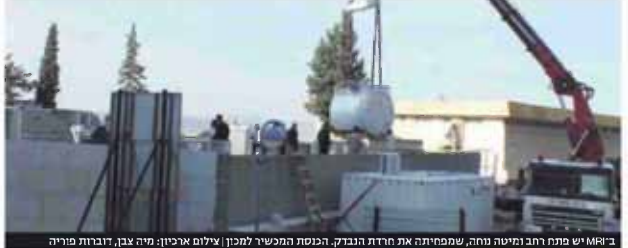
מכשיר MRI שימנה רחוב מטישה נוח, שמפחית את חרדת הנבדק. הכנסת המכשיר למכון | יוליאנו ארנון, מיה צבן, בדרות פוריה

המכשיר היקר הגיע לבית החולים לפני חודשים ארוכים, אך רק לאחרונה התקבל אישור האלוס מכבאות של • שירותי הכבאות מחוז צפון: רוב הרישיות נגועות למערכות מצילות חיים, יש עוד דרישות שטרם הוסרו