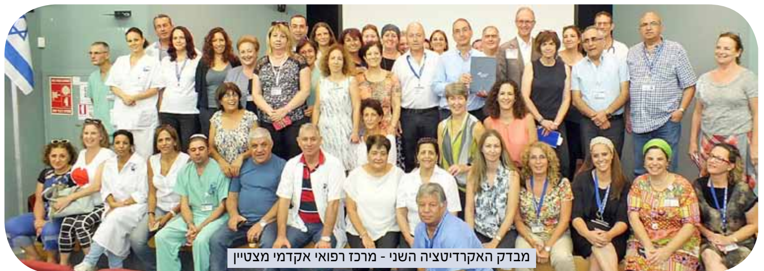
מבדק האקרדיטציה השני - מרכז רפואי אקדמי מצטיין