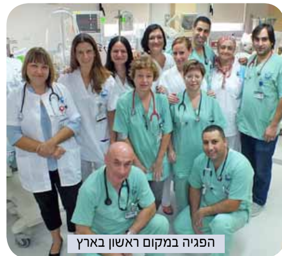
הפגיה במקום ראשון בארץ