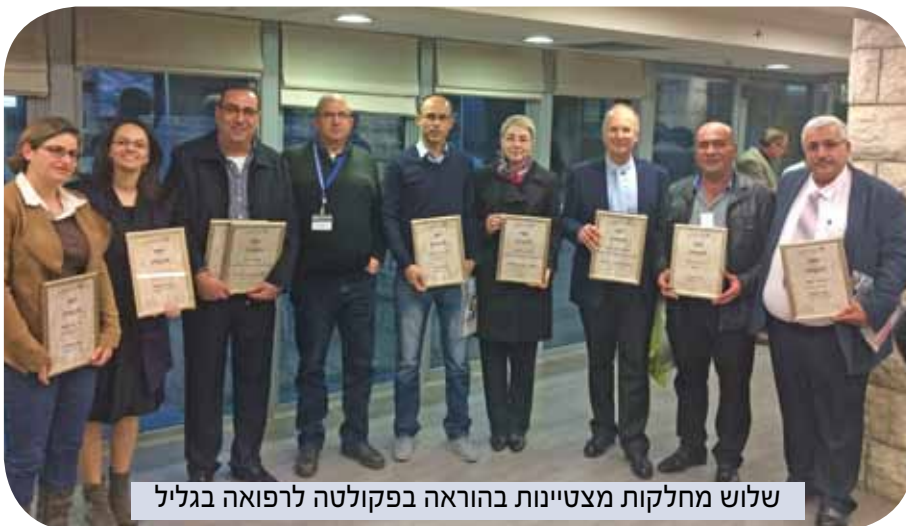
שלוש מחלקות מצטיינות בהוראה בפקולטה לרפואה בגליל