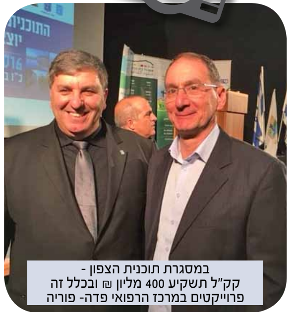
במסגרת תוכנית הצפון - קק"ל תשקיע 400 מיליון ₪ ובכלל זה פרויקטים במרכז הרפואי פדה- פוריה