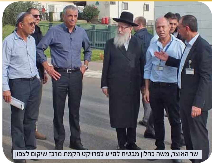
שר האוצר, משה כחלון מבטיח לסייע לפרויקט הקמת מרכז שיקום לצפון