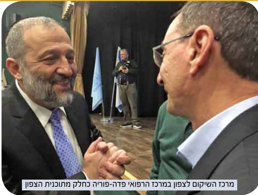
מרכז השיקום לצפון במרכז הרפואי פדה-פוריה כחלק מתוכנית הצפון