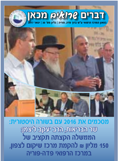
מסכמים את 2016 עם בשורה היסטורית: שר הבריאות, הרב יעקב ליצמן; הממשלה הקצתה תקציב של 150 מיליון ₪ להקמת מרכז שיקום לצפון, במרכז הרפואי פדה-פוריה

זכינו לביקורו של שר הפנים, פיתוח הפריפריה הנגב והגליל, הרב אריה מכלוף דרעי. השר שיזם את התוכנית לחיזוק הגליל, הביע את מחויבותו לחיזוק שירותי הרפואה בגליל, והמשיך פיתוח