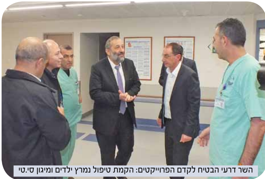
השר דרעי הבטיח לקדם הפרוייקטים: הקמת טיפול נמרץ ילדים ומיגון סי.טי