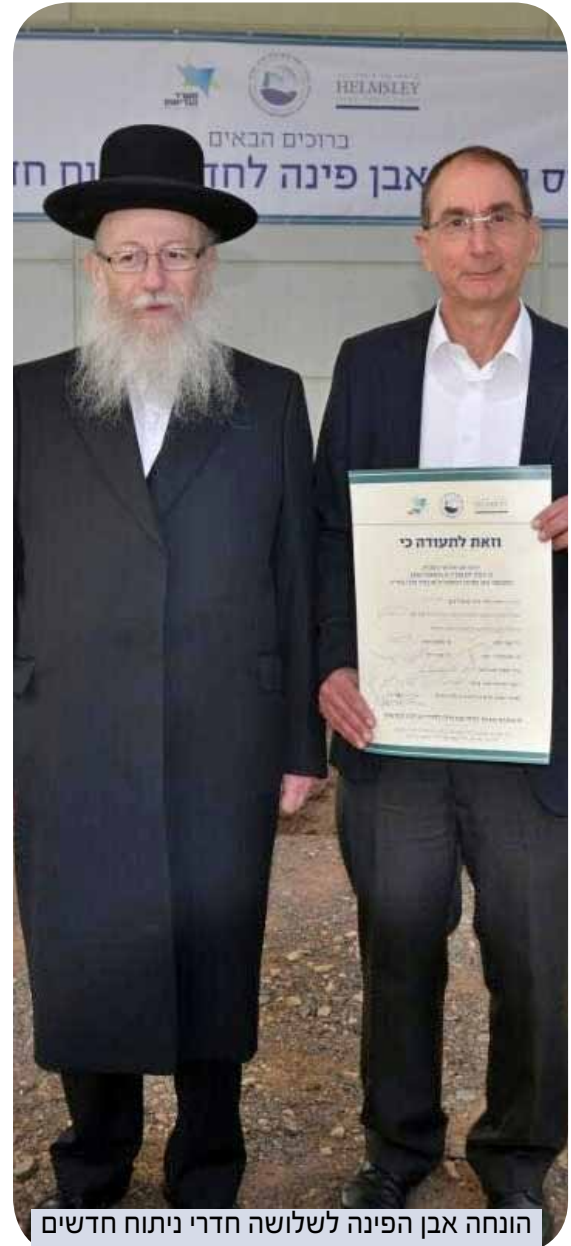
הונחה אבן הפינה לשלושה חדרי ניתוח חדשים