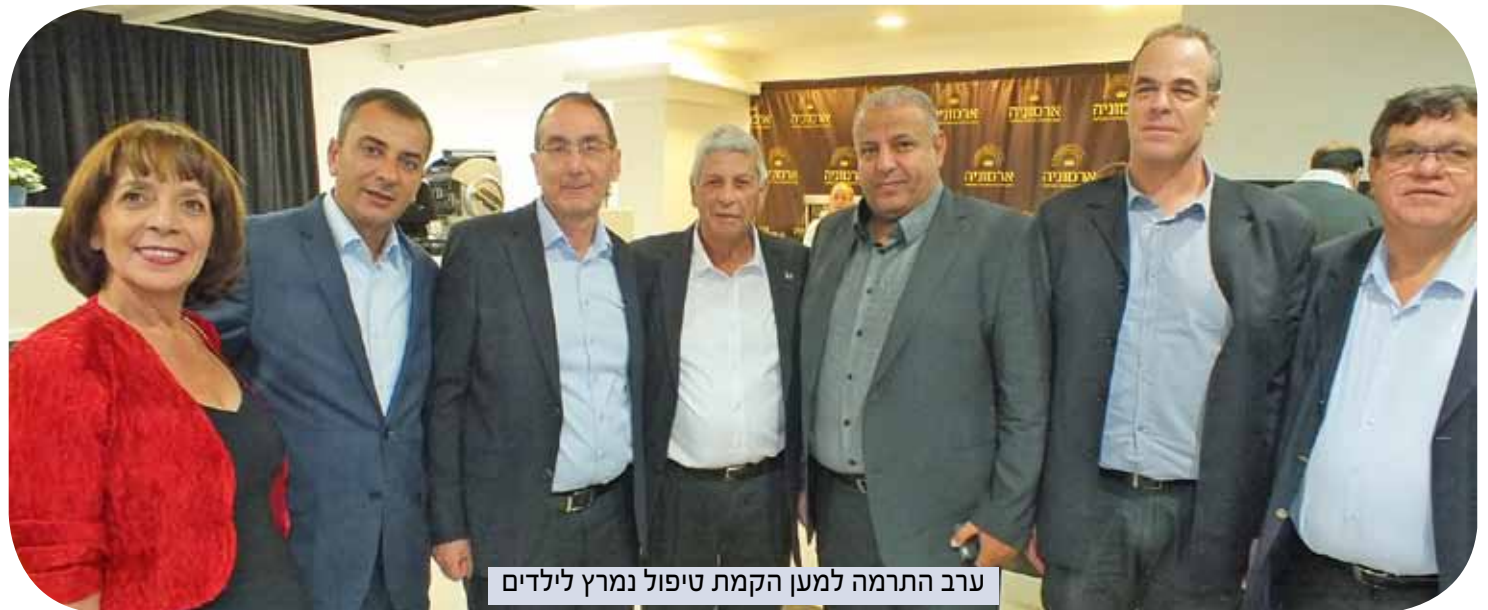
ערב התרמה למען הקמת טיפול נמרץ לילדים