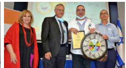
הצטיינות למחלקת ילדים