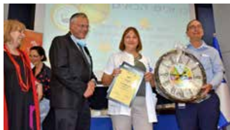
הצטיינות למחלקת פגים וילודים