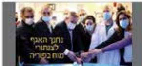
חממת שיובר נחנך האגף לצנתורי מוח בפדה-פוריה במעמד שר הבריאות ונכבדים נוספים