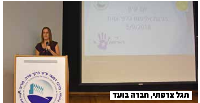
תגל צרפתי, חברה בוועד

לסיכום, הועדה למניעת אלימות פועלת ליישום התפיסה והמסר - אפס סובלנות לאלימות, תוך שמירה על הנהלים ואכיפתם ומתן תחושת ביטחון לעובדי המרכז הרפואי, בכל שעות היממה. באמצעות שיתוף פעולה שיטתי בין עובדי המרכז הרפואי וחברי הועדה למניעת אלימות, נוכל יחד למזער את התופעה.