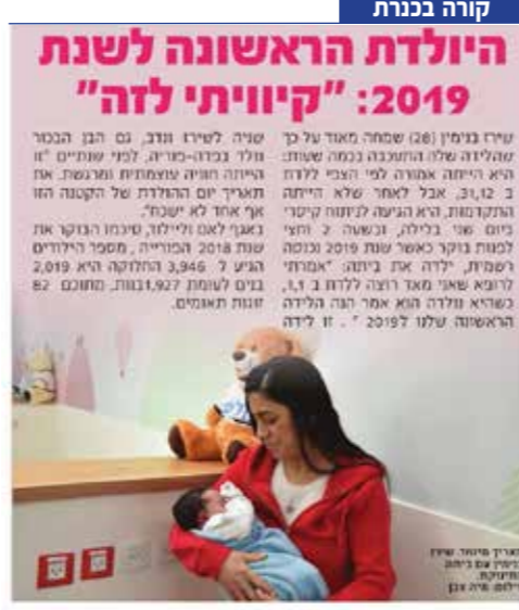
היולדת הראשונה לשנת 2019: "קיווית לזה".