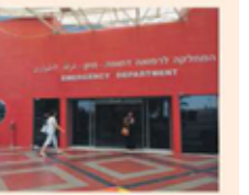
מיון אסף הרופא

מבין בתי החולים הבינוניים, שאלהם מניעות מדי שנה 90-50 אלף פניות, זכה בציון הגבוה ביותר (מקום כללי חודשי המיון בית החולים פוריה 88.8), אחריו הלל יפה (84.9) וזו (83.6). למקומות האחרונים הגיעו חרדי המיון של וולפסון (63.2) ושערי צדק (56.7).