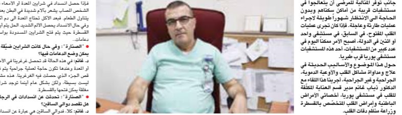
מנכ"ל מנהל תחנת המיון ב"פדה-פוריה", לראשית "הצנרת".

תחילת הצממות הליבית והתחילת הצנרת פי הצלר ובתחילת מוצעי לייס בעמלה קלב מפתח. מנכ"ל מנהל תחנת המיון ב"פדה-פוריה", לראשית "הצנרת".